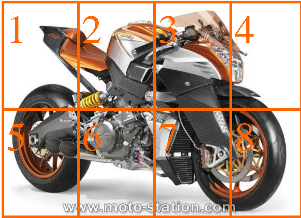
Aprilia FV2 1200