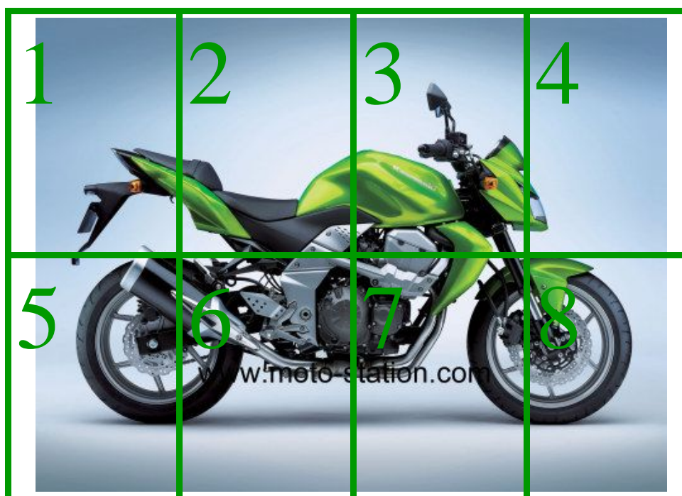
Kawasaki Z 750