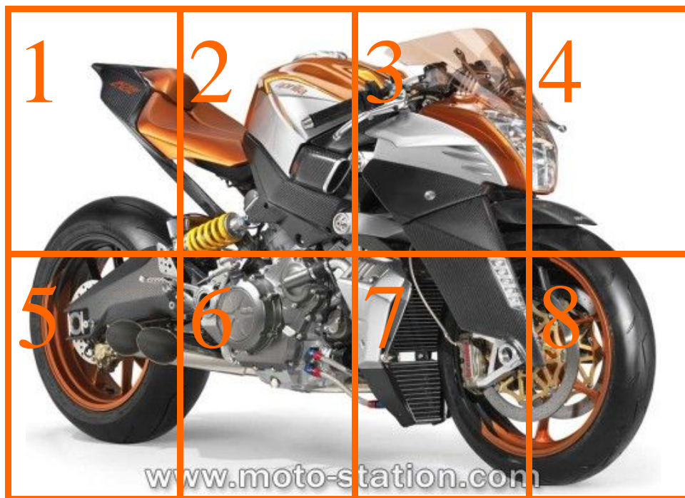
Aprilia FV2 1200