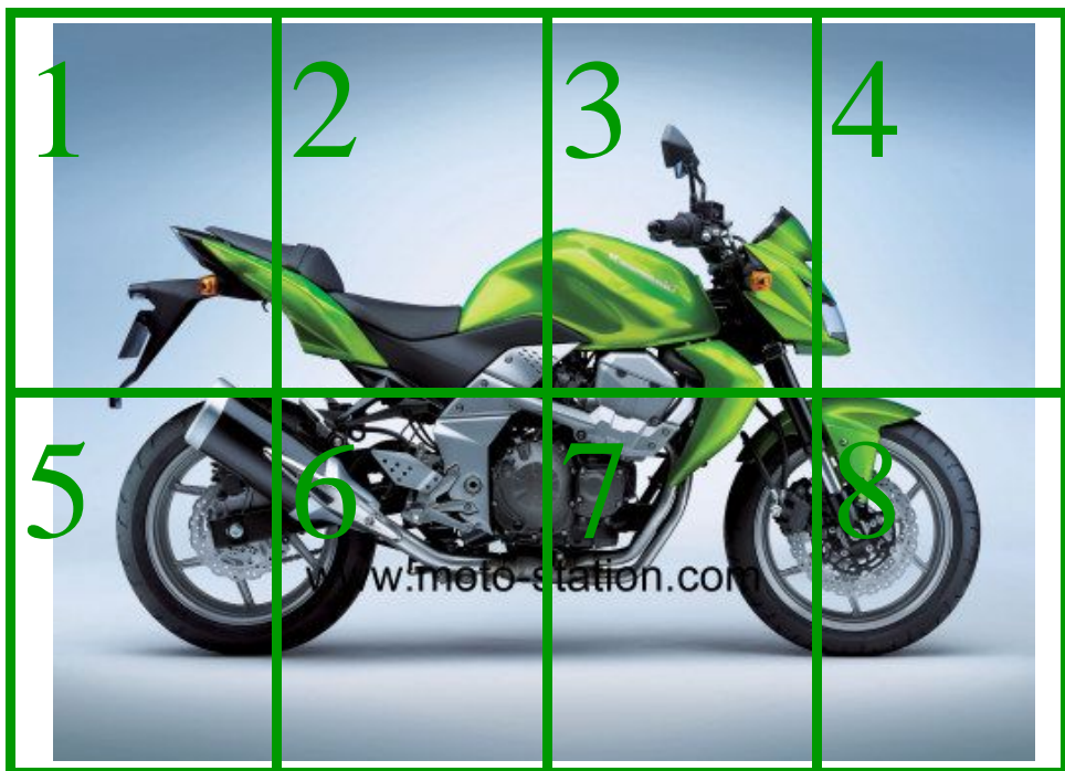
Kawasaki Z 750